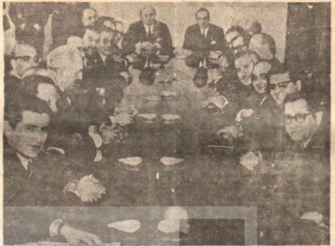
Başbakan Demirel, SBF öğretim üyeleriyle «Özgürlük ve Anayasa!..»

Çağlar'ın son kurbanları alevî şairi Hıtaş'ın gecesi tertipleyicileri ve konuscuları oldu. Ruhi Su, Can Yücel ve Yaşar Kemal ile Aşık Nesimi, dinî siyasete âlet etmiş, halkı sınıflara